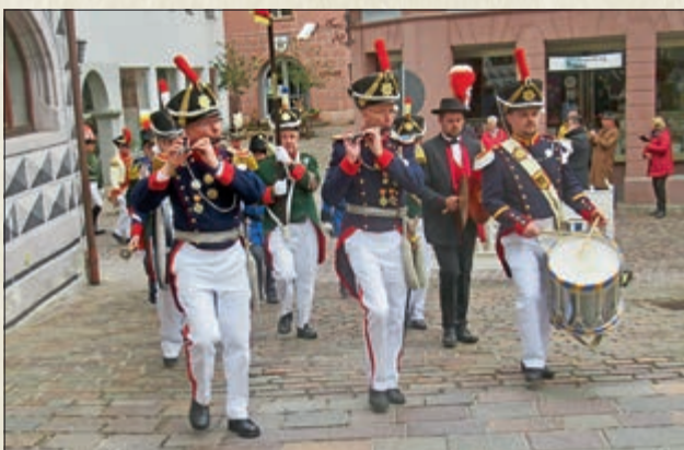
An der Spitze Spielleute der Bürgerwehr Waldkirch, die für den Gleichschritt sorgen.