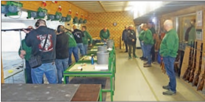
Das Brettener Ladeteam fertigte auf sechs Schießbahnen in nur drei Stunden über 75 Schützen ab.