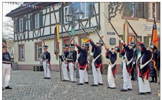
Ehrenschat für Geistlichkeit und Bürgermeister