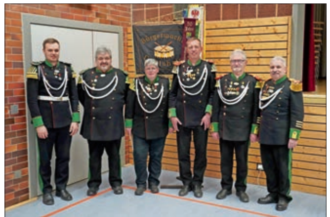
Medaillenverleihung aktive Mitglieder