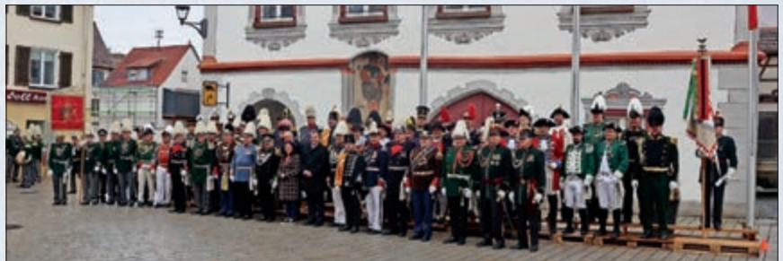
Alle Teilnehmer vor dem Munderkinger Rathaus