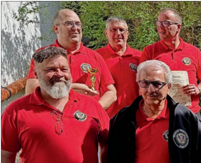
Die Kameraden der Ehinger Bürgerwache konnten auch in der Mannschaftswertung nach den Brettener Schützen den zweiten Platz belegen.