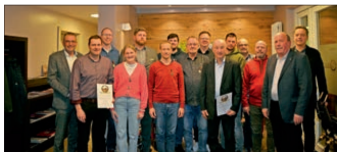
Sie wurden bei der Korpsversammlung der Bürgerwache Ehingen geehrt.

Text: Sven Hannuschka