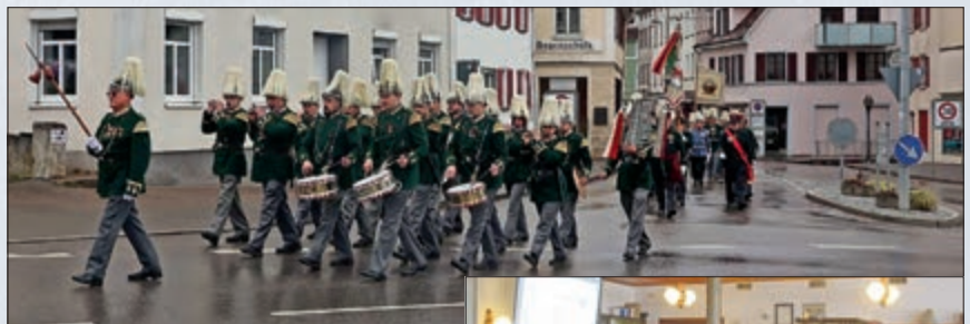
Spielmannszug Saulgau in Aktion