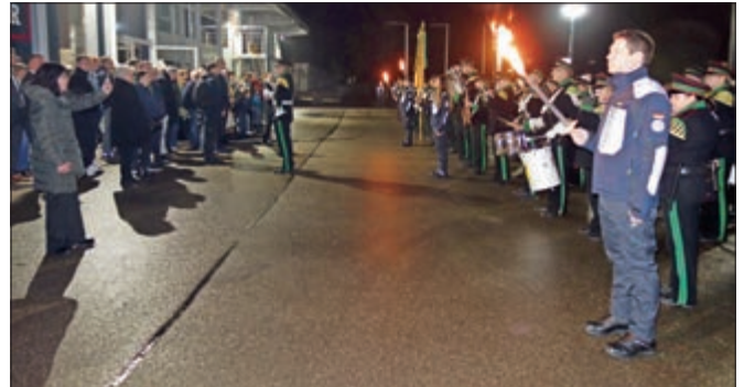
Angetretene Formation zur Abendserenade vor dem Hangar

Text: Jürgen Rosenäcker/Stadt Crailsheim