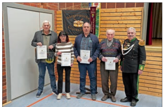
Ehrung passiver bzw. fördernder Mitglieder