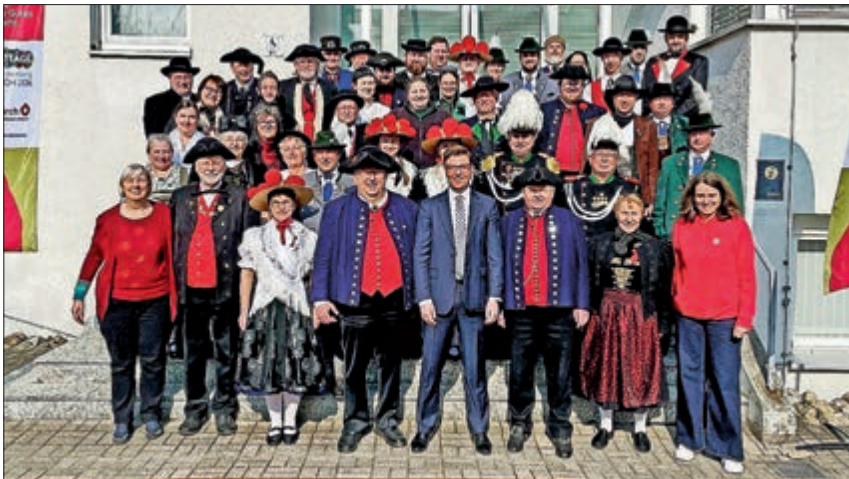
Gruppenfoto der Tagungsteilnehmer

Text: Jürgen Rosenäcker