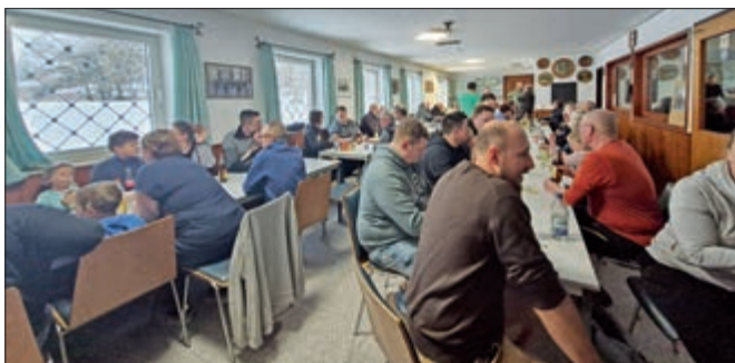
Abschluss im Schießstandlokal