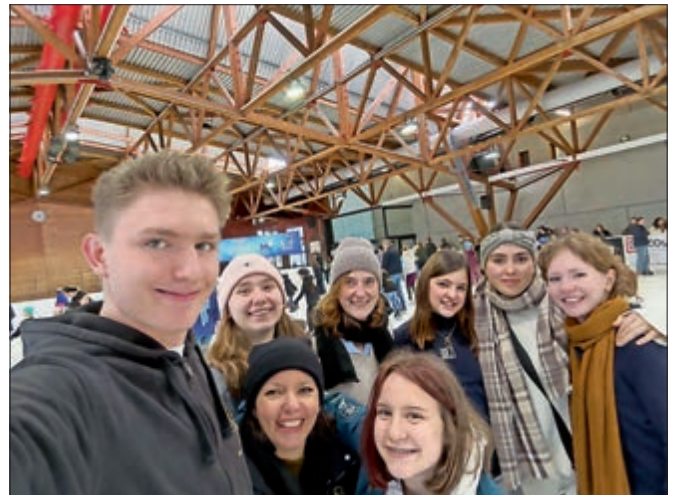
Stadtgarde beim Eislaufen