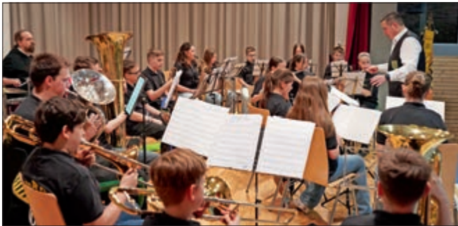
Nachwuchsorchester „NBO“ im Einsatz