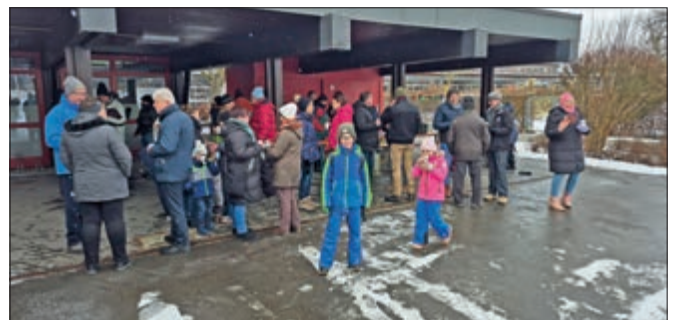
Bei der Wanderung waren Jung und Alt dabei.

Traditionell brach die Ehinger Bürgerwache am Dreikönigstag zu ihrer Winterwanderung auf.