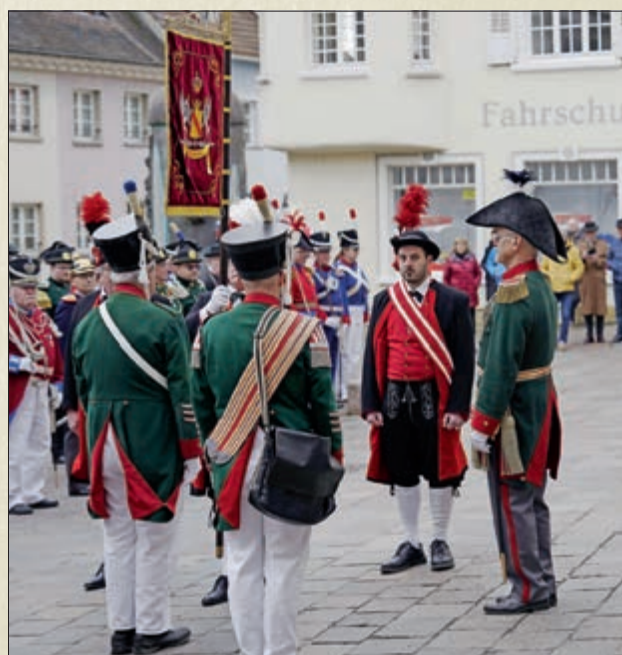
Anschließend übergab die Hist. Bürgerwehr Bretten die Landesstandarte an die Bürgermiliz Bad Peterstal.