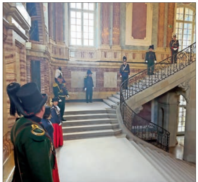
Stadtgarde bei der Verleihung der Landesverdienstorden im neuen Schloss